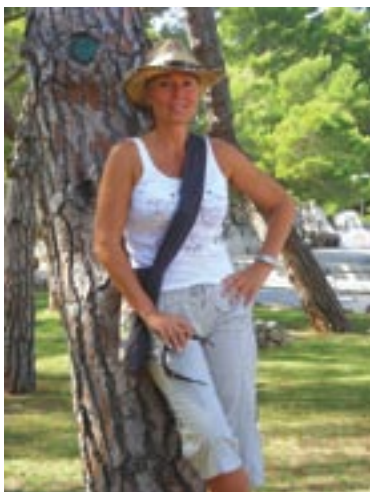
Fahreta Živojinović - Lepa Brena

- Taj dar imam još od djetinjstva, ali nisam znala racionalno ga spoznati. Na njega mi je još odavno ukazala bugarska proročica Vanga i upozorila me da ga dobro pratim. Tek sada ga mogu racionalno koristiti.