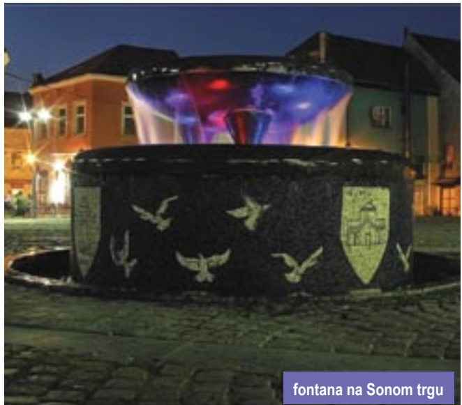
fontana na Sonom trgu

Dođi, putniče, Tuzlacima na njihove tuzlarije. Bit ćeš i sam bogatiji, vlastitoj duši ugodniji podatniji. Da ne povjeruješ: Starica milenijska, a alem djevojka!