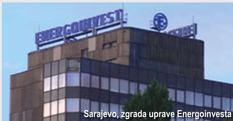
Sarajevo, zgrada uprave Energoinvesta

što trenutno posluje na svjetskom tržištu, ali i zbog nedostatka fleksibilnosti menadžmenta, Vlahovljak kaže da će kompanija morati da bude privatizovana u što skorije vrijeme.