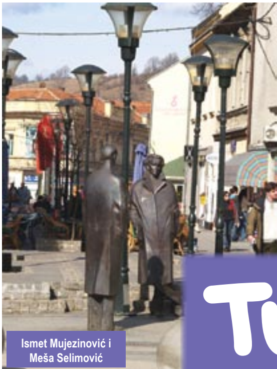
Ismet Mujezinović i Meša Selimović