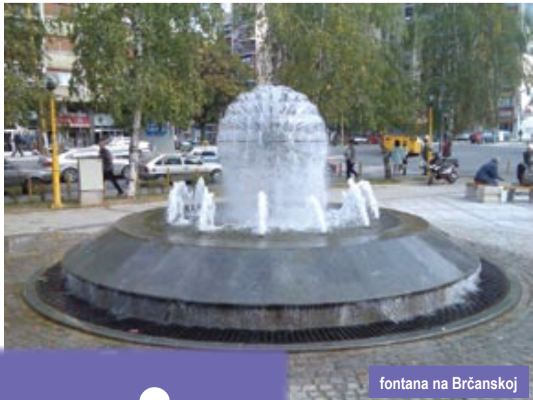
fontana na Brčanskoj