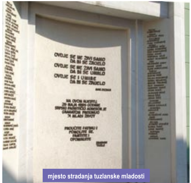
mjesto stradanja tuzlanske mladosti