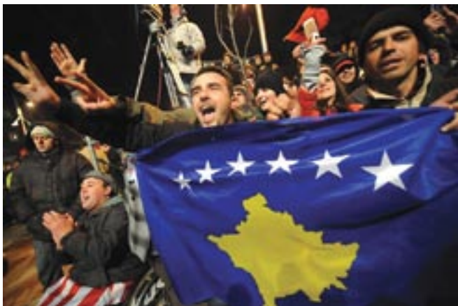
Tokom slovenačkog predsjedavanja Kosovo je proglasilo nezavisnost

Prvog januara ove godine je Slovenija bila prva od takozvanih „novih“ država EU koja je preuzela ulogu predsjedavajućeg u ovoj organizaciji. Šest mjeseci proteklo je uglavnom u bavljenju balkanskim problemima