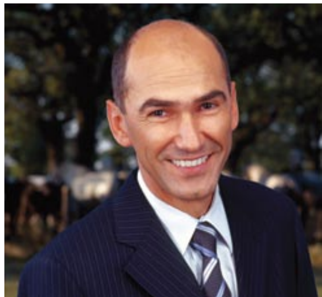
Janšin tim progurao je u Briselu niz zakona

Dva događaja koja su obilježila protekle mjesece su se izmakla kontroli. Slovenija je dobro izvela stvari kada je riječ o nezavisnosti Kosova, ako se u obzir uzme koliko je nejedinstvo unutar unije vladalo o tom pitanju. Okolnosti su bile teške i posao je urađen dobro. Slovenački mandat je ipak zasjenilo irsko „ne“ na referendumu, ali tu Ljubljana i nije mogla izmijeniti ništa. U EU je još uvijek sporno da li i ostale zemlje Balkana mogu i bez ratifikovanog ugovora iz Lisabona postati članice ove organizacije.