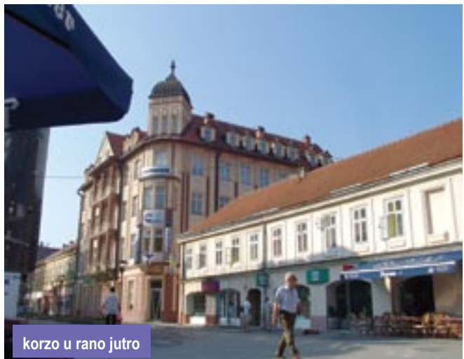
korzo u rano jutro