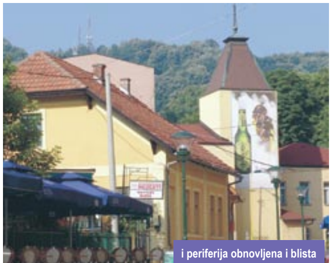
i periferija obnovljena i blista