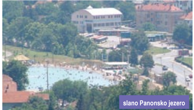
slano Panonsko jezero

Šta to još ima Tuzla, a da niko nema? Da, dakle, osim nje-