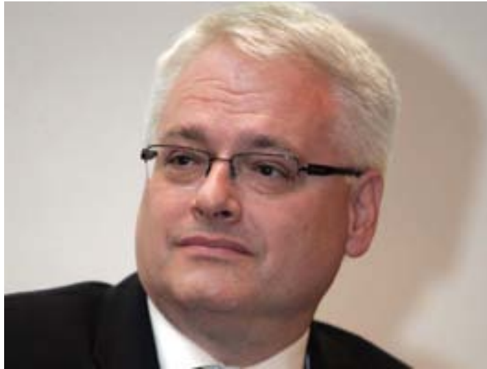
Predsjednik Hrvatske Ivo Josipović

Ovi su izbori i snažna poruka Kaptolu. Jasno je da njihov