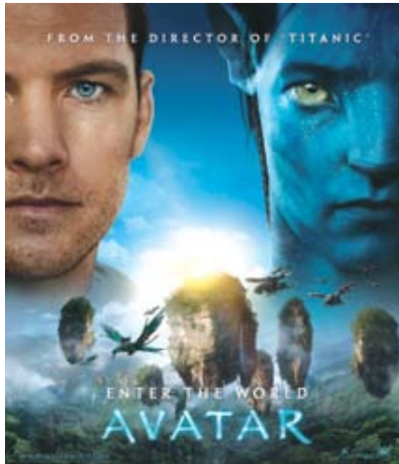
Naučno-fantastični film Jamesa Camerona Avatar, prestigao je Titanic i postao film sa najvećom zaradom svih vremena.

Kada je riječ o glavnim ulogama koje bi mogle biti nominirane za Oscara, svakako prednjače Sandra Bullock koja je već osvojila Zlatni globus, nagradu SAG, i nagradu Udruženja filmskih kritičara, te Jeff Bridges koji je također dobio Zlatni globus za ulogu u filmu "The Crazy Heart", zatim nagradu SAG, priznanje Udruženja filmskih kritičara, te Udruženja filmskih kritičara Los Angelesa.