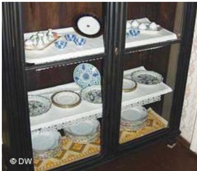
Tanjiri, čaše, šoljice iz 19. vijeka

sjeća na tek sitne specifičnosti pojedine kulture. „Ako odete u naš muzejski prostor 'Svrzinu kuću', vidjećete da se tamo jelo sjedeći na podu, a ako odete u Despića kuću, gdje se vidi