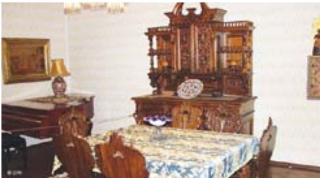
U ovakvim trpezarijama su jela bogati Sarajlije